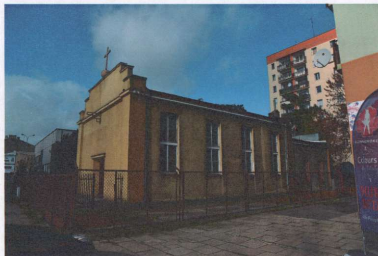
Kaplica z przybudówką, widok ogólny z kierunku pld.-wsch.