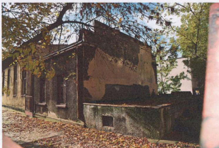
Przybudówka kaplicy, widok z kierunku pln.-wsch.