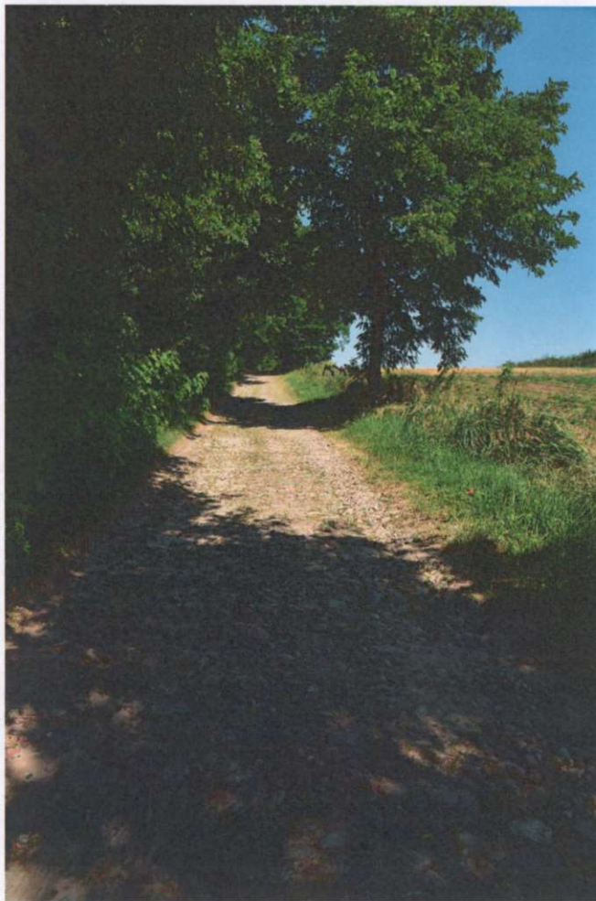
Widok ogólny drogi w kierunku północno-wschodnim (na Chełmce)