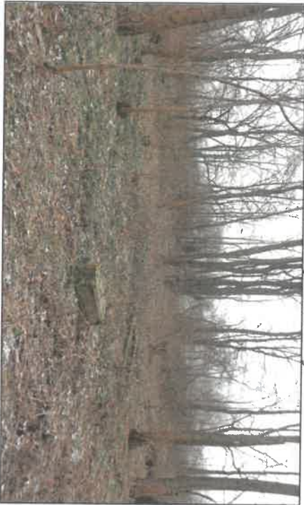
Fot.3. Ogólny widok na teren cmentarza.