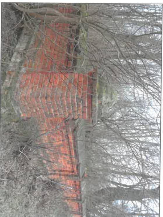
Fot.2. Częściowo zachowane historyczne ogrodzenie cmentarza.