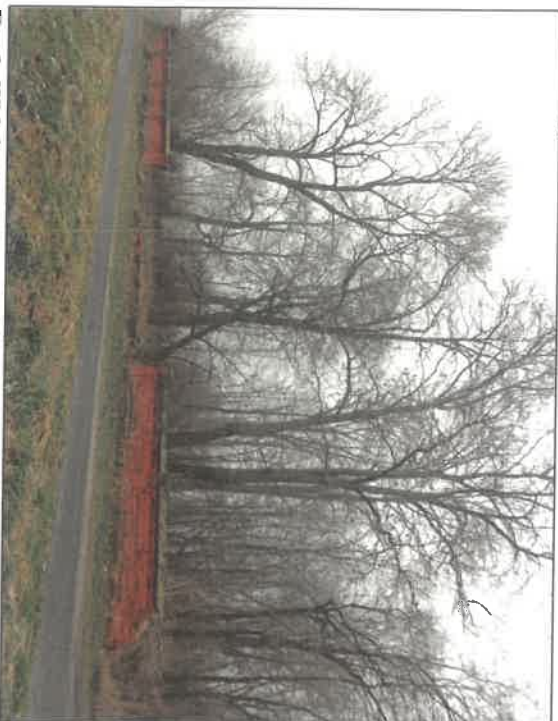
Fot.1. Widok na cmentarz od strony zachodniej.